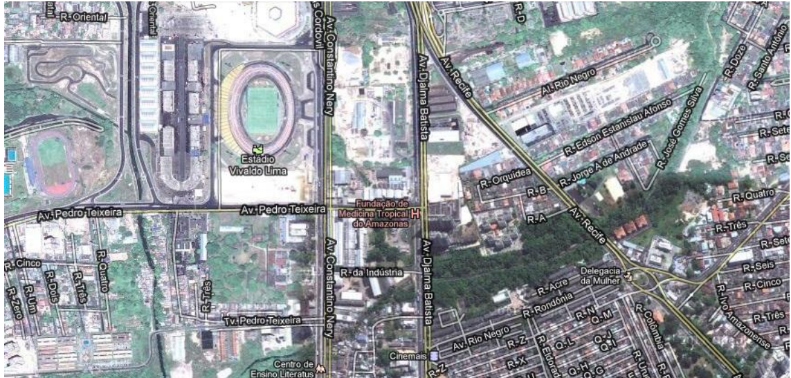
Figura 1: Cruzamento das avenidas Constantino Nery X Pedro Teixeira.