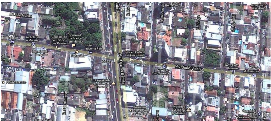
Figura 2: Cruzamento das avenidas Djalma Batista X João Valério